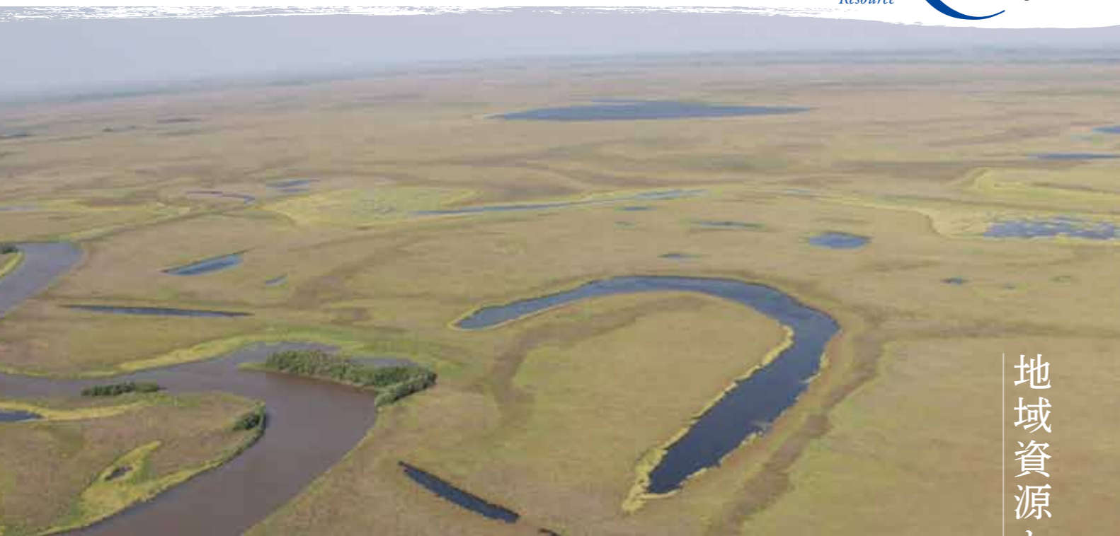
〈コウノトリの繁殖地であるロシアの湿原〉