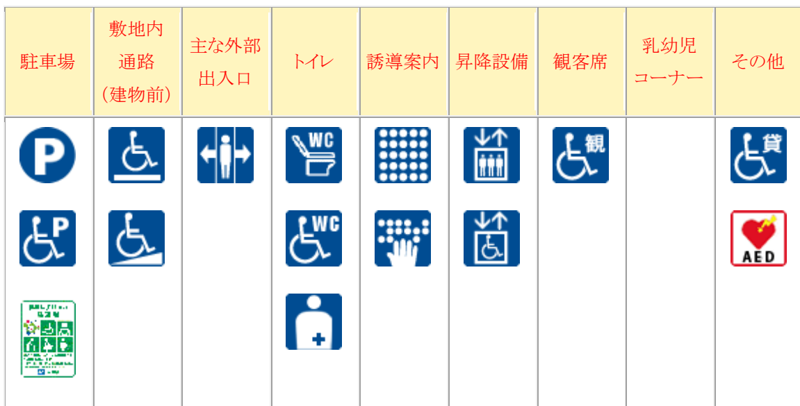
神戸商科キャンパスのユニバーサル施設情報

なお、神戸商科キャンパスのユニバーサル施設情報は下表のとおりであり、この情報は会計専門職専攻のホームページにも掲載している。