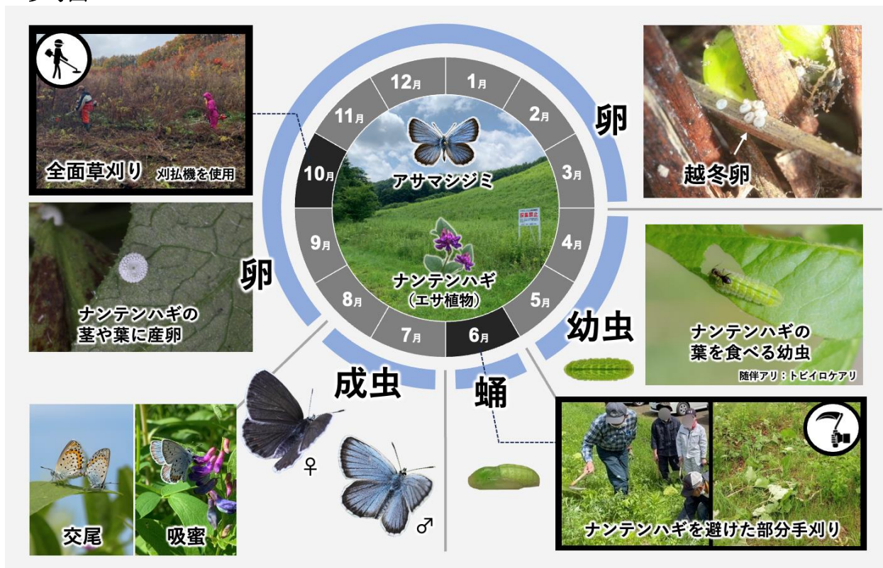
図1 研究概要 (アサマシジミ北海道亜種の生活サイクルを踏まえた草刈り時期と方法)